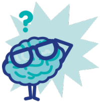
Construction B →